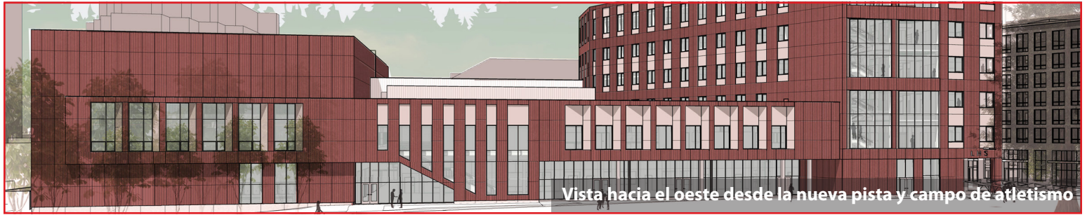
Vista hacia el oeste desde la nueva pista y campo de atletismo